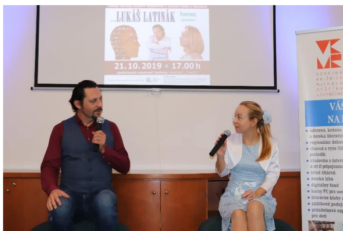
Talkšou „Povedz mi, čo čítaš“ s hercom Lukášom Latinákom